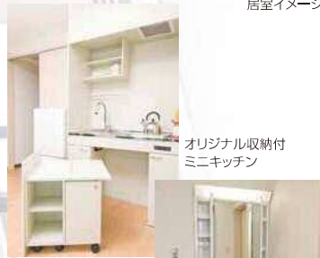
オリジナル収納付ミニキッチン