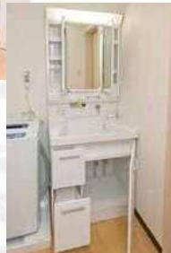
収納力抜群の三面鏡 深めのシンクは、シャンプーにも十分に対応