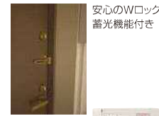
安心のWロック 蓄光機能付き